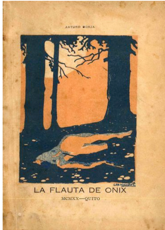
Fig. 2: Arturo Borja Pérez, La Flauta de Ónix , Quito, 1920.